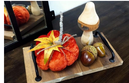
MITTROP S PIEKER, 21.09.