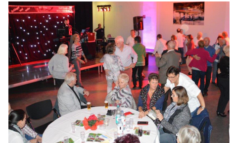
UM ACHT AM SCHACHT, 17.11.