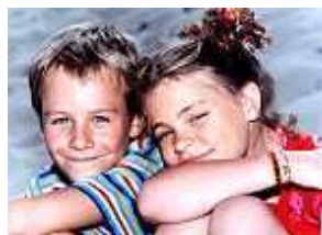
Pünktchen und Anton