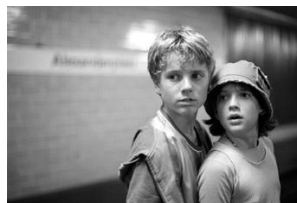
Emil und die Detektive