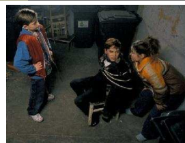
Das fliegende Klassenzimmer